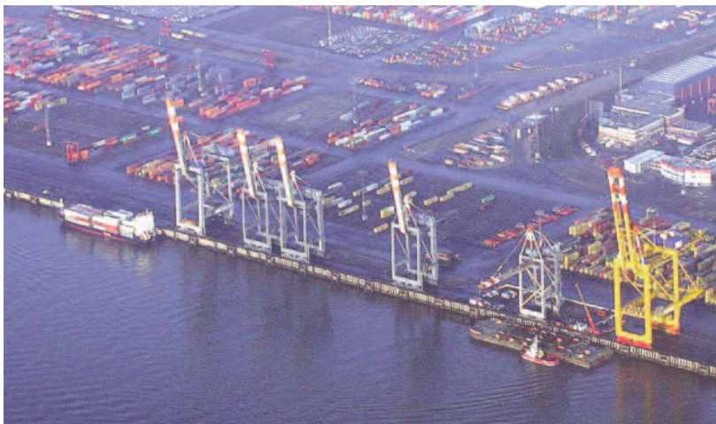
Nichts läuft mehr in Bremerhaven

Es ist also gar nicht so unwahrscheinlich, dass im Jahre 2012 die Umschlagbrücken auf dem fertigen JWP auf sich warten lassen. Vielleicht ist die aus Galgenhumor geborene Idee von der einzigen temperierten Badelagune an der Nordsee ein gar nicht mal so abwegiger Notausgang auf dem Weg zur "Boomtown Wilhelmshaven"? □